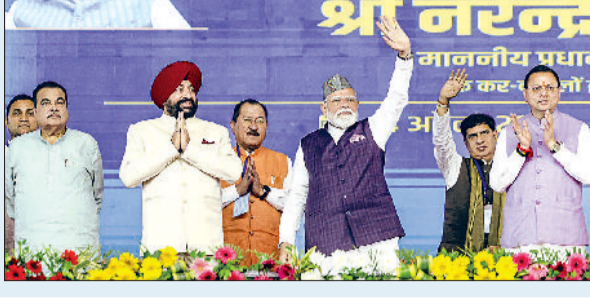
पीएम ने कहा कि एक्सप्रेसवे और इकोनॉमिक कॉरिडोर विकास के गेटवे हैं। इससे समय और खर्च दोनों कम होंगे। रोजगार बढ़ेगा और किसानों की उपज तेजी से बाजार तक पहुंचेगी, जिससे पूरे क्षेत्र की अर्थव्यवस्था मजबूत होगी। पीएम ने कहा कि सड़क, रेल और एयरवेय देश की भाव्य रखाएं हैं। यह सिर्फ आज की सुविधा नहीं, बल्कि आने वाली पीढ़ियों के लिए निवेश है।

12,000 करोड़ रुपये की लागत से बना दिल्ली-देहरादून एक्सप्रेसवे कॉरिडोर 210 किमी लंबा, 6 लेन और एक्सप्रेस कंट्रोल कॉरिडोर 12,000 करोड़ रुपये की लागत से बना है। यह दिल्ली, उत्तर प्रदेश और उत्तराखंड को जोड़ता है और इससे शुरू होने से दिल्ली-देहरादून के बीच की दूरी 6 घंटे से घटकर करीब ढाई घंटे रह जाएगी।